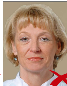
Hintergrund ohne Kontrast