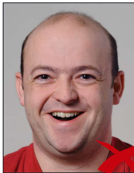
Mund zu weit offen

Die Person muss mit neutralem Gesichtsausdruck und geschlossenem Mund gerade in die Kamera blicken. ◀