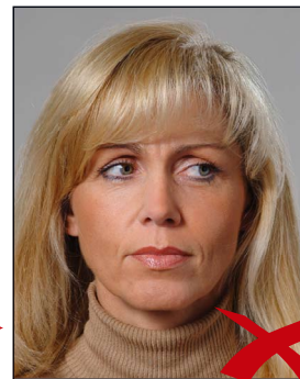
Blick zur Seite