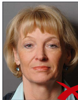
Schatten im Hintergrund

Auf dem Hintergrund dürfen keine Schatten entstehen. ◀