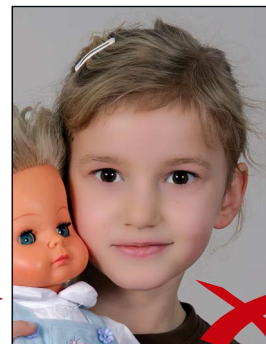
Gegenstand im Bild