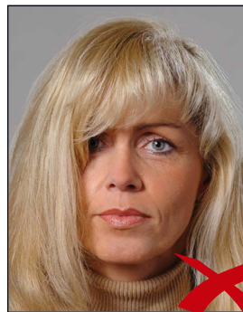
Haare im Gesicht