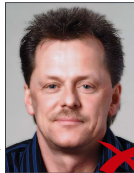
Reflexion im Gesicht