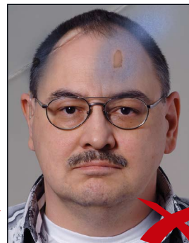
Knicke und Tintenflecke im Bild