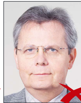
Kontrastarm durch Überbelichtung